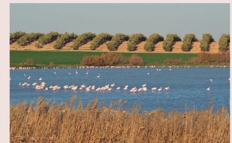
Humedales de Osuna