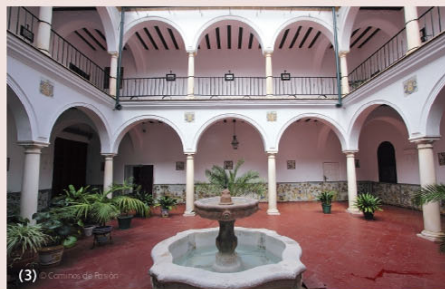
Monasterio de la Encarnación