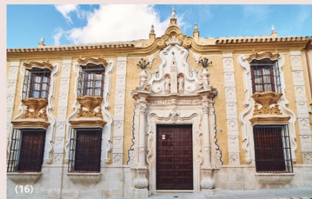
Cilla del Cabildo General