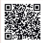
Senderos Turísticos de Osuna

Con un bondadoso clima de agradables temperaturas, posee una completa red de comunicaciones que permite un rápido y cómodo transporte desde cualquier punto de Andalucía. Los aeropuertos de Sevilla y Málaga se hayan a tan solo una hora mientras que la A-92, autovía que conecta el sur con el levante peninsular pasa por su término.