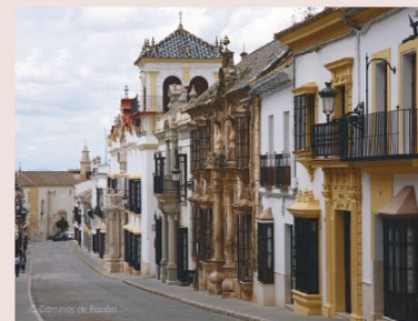
Calle San Pedro