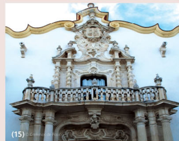
Palacio del Marqués de la Gormera